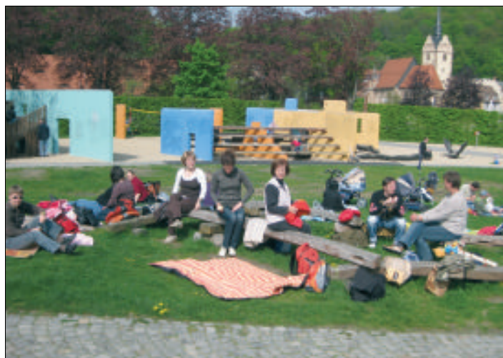
Picknick im Hofwiesenpark

meinsam einmal Zug zu fahren. Das Ziel war Gera, am Theater vorbei, durch den blühenden Küchengarten ging es dann entlang der Orangerie auf den Spielplatz des Hofwiesenparkes. Eine Riesenfreude bei den Kindern, die sehr schnell die Spielgeräte erkundet hatten. Die Erwachsenen hatten Zeit, sich auf der Picknick-