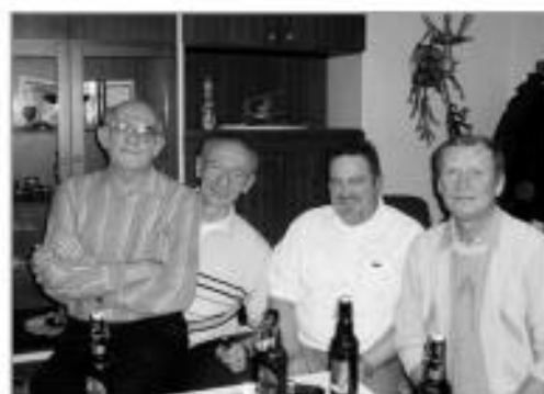
Tischtennisspieler im Vereinszimmer