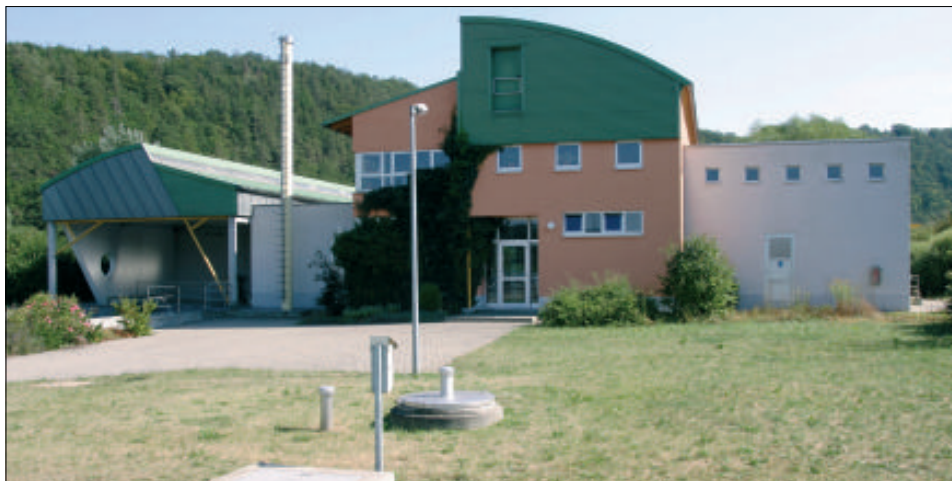
Die Kläranlage Weida mit ihrem Hauptgebäude.