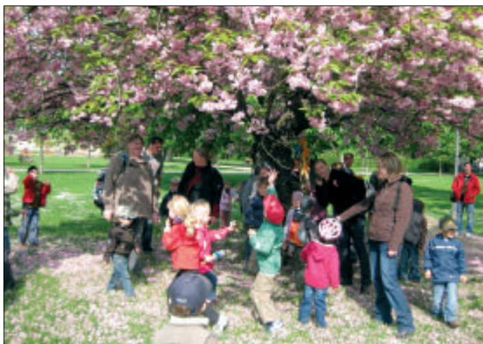
Blütenschnee über unseren Köpfen im Küchengarten

Wir schenken den Eltern zum Mutter- und Vattertag Zeit mit ihren Kindern und gehen gemeinsam wandern... das war wieder der Grundgedanke unseres zweiten Familienwandertages am Samstag, den 8. Mai. Das Wetter spielte mit und so kamen viele Eltern mit Kindern, auch Geschwistern und Großeltern, um mit uns ge-