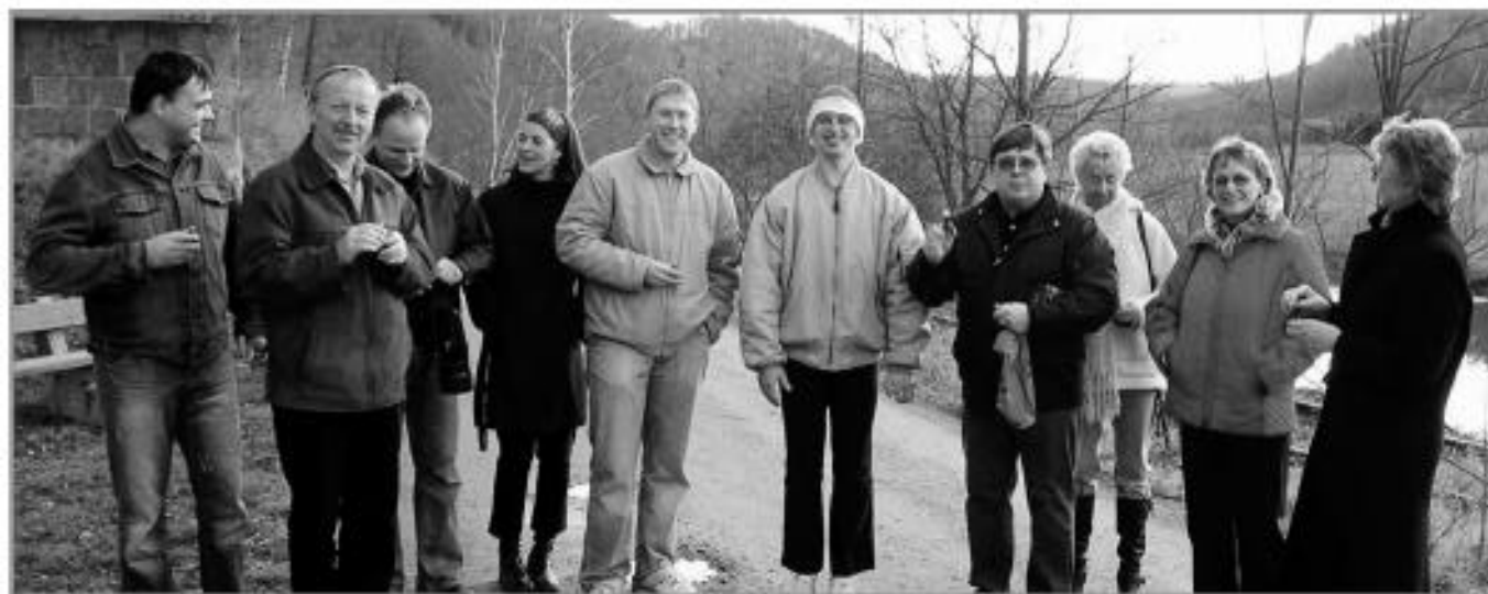
Ausflug Sektion Tischtennis ins Elstertal, 2005