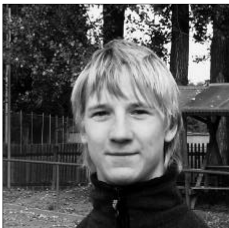
Nachholspiel vom 17. Spieltag ThSV Wünschendorf - Motor Zeulenroda II 3 : 3