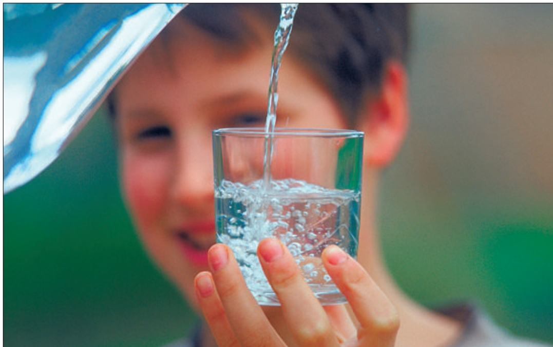
Trinkwasser - Günstige Preis - immer beste Qualität. Quelle: OTWA

Im Gebiet des Zweckverbandes Wasser/Abwasser „Mittleres Elstertal“ (ZVME) befinden sich zahlreiche Brunnen, so u.a. in Caaschwitz, Scheubengrobsdorf, Liebschwitz. Außerdem gibt es Quellen, die auch die Versorgung der einzelnen Regionen sichern, so die Quellen Reichardttsdorf, Gleina, Niederndorf Zedlitz, Sirbis und Seifertsdorf.