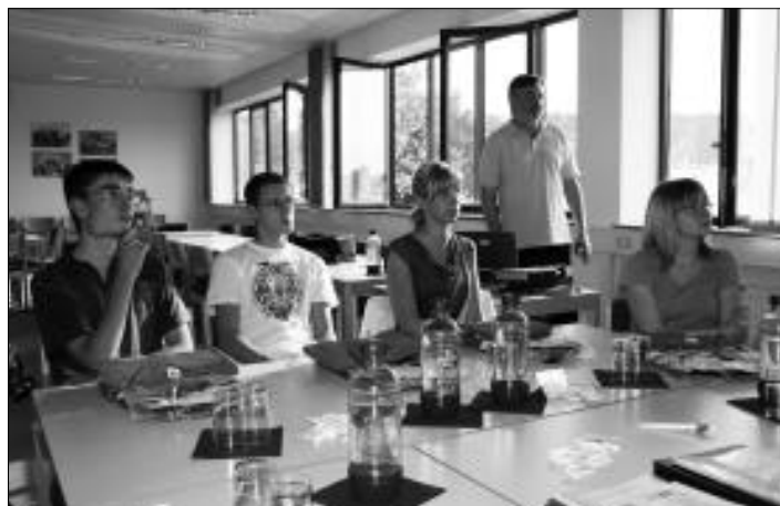
Am ersten Ausbildungstag gab es eine Reihe von Informationen für die vier neuen Azubis.

WA ist ein Tochterunternehmen des Umweltdienstleisters Veolia Wasser. Der Ausbildung des Fachkräfte-Nachwuchses kommt in der Dienstleistungs- und Servicebranche eine Schlüsselrolle zu. So auch bei Veolia Wasser. Das Unternehmen hat sich freiwillig zu einer Ausbildungsquote von über acht Prozent verpflichtet. Nach erfolgreich abgeschlossener Ausbildung erhalten die Azubis in der Regel ein Angebot für einen befristeten Arbeitsvertrag. Durch die Zugehörigkeit zur Veolia Wasser Gruppe, eröffnet sich den jungen