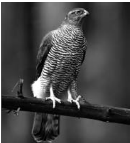
Auch Habichte gehören zu den streng geschützten Arten.

Nach nunmehr einem Jahr der Zuständigkeit für den Vollzug des Artenschutzrechts in den unteren Naturschutzbehörden der Landratsämter und kreisfreien Städte zeigen sich noch immer erhebliche Lücken in der gesetzlichen Meldepflicht.