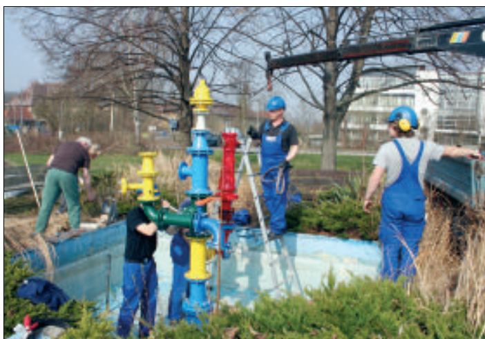
Der Springbrunnen wurde aus dem Winterschlaf geholt.

Den Springbrunnen im Grünen erweckten die Auszubildenden aus dem Trinkwasserbereich aus dem Winterschlaf. Aus alten vorhandenen Formstücken, einem alten Hydranten und einer Gießkanne wurde zudem ein „WasserKunstwerk“ erstellt, für welches noch ein Name gesucht wird.