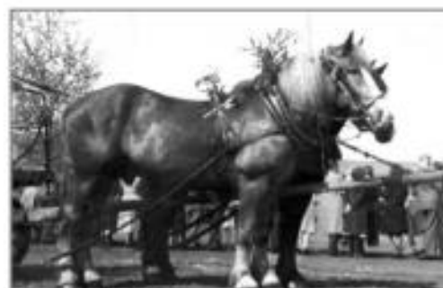
Blick auf den alten Sportplatz