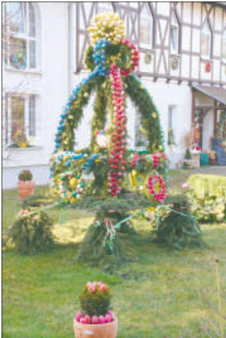
Osterkronen - Team Bahnhofstraße

Viele Besucher haben eine Wanderung rechts oder links der Elster unternommen und freudig mitgeteilt, wie schön unsere Umgebung ist, lobten die Initiative aller Beteiligten, den wohl-schmeckenden Kuchen und versprochen 2010 wieder zu kommen. Ein großes Dankeschön gilt allen Helferinnen,