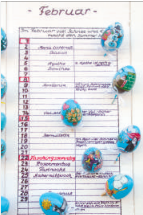
Teilstück aus dem Bauernkalender - Bahnhofstraße

Viele Besucher haben eine Wanderung rechts oder links der Elster unternommen und freudig mitgeteilt, wie schön unsere Umgebung ist, lobten die Initiative aller Beteiligten, den wohl-schmeckenden Kuchen und versprochen 2010 wieder zu kommen. Ein großes Dankeschön gilt allen Helferinnen,