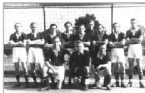
Vor dem Spiel gegen Triebes im August 1948 (9 : 0)