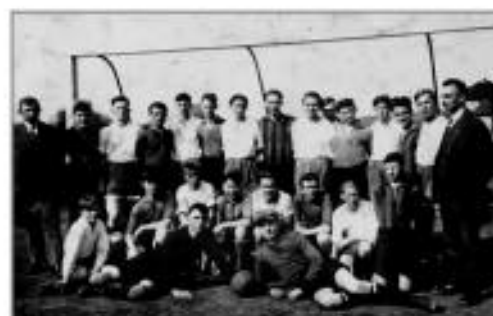
Fußballmannschaft 50er Jahre

1961 fuhr unsere 1. Mannschaft zu einem Freundschaftstreffen nach Röthenbach, bei Nürnberg.