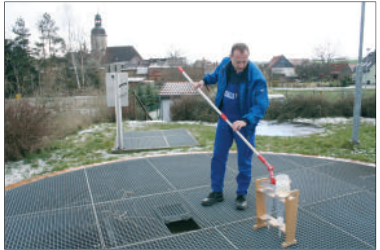
Wartungen an Kleinkläranlagen führt auch die OTWA durch.

Allerdings sollte sich jeder Grundstückseigentümer, wenn er an eine Erneuerung seiner Kleinkläranlage denkt, unbedingt zunächst von den OTWA-Fachleuten beraten lassen. Nur so kann der Antragsteller sicher sein, dass er beim Neubau auch auf der sicheren Seite ist und den