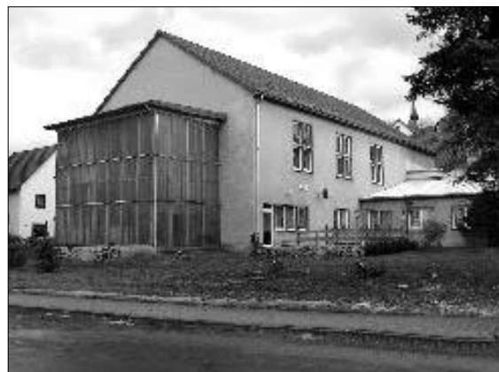
Turnhalle Veitsberg im Jahr 2004

Daher wurde am 04.11.1950 die BSG Stahl Wünschendorf in Leipzig gegründet.