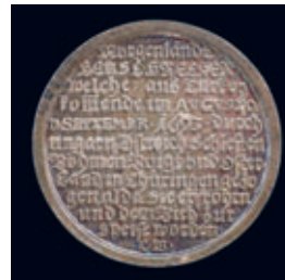
Medaille in Sammlung des Heimatvereins.

In diesem Jahr kamen aus Asien große Züge von Heuschrecken, die sich bei Pest (Budapest) niedergelassen hatten. Nach den Zeitungsberichten brachen sie von dort den 14. August auf, der eine Zug ging nach Wien los, der andere machte über die Donau, durch Mähren, Böhmen, Oberschlesien und durch einen Südwind ins Vogtland nach Thüringen. Am 16. und 17. August 1693 zogen sie durch Plauen und am 25. August kamen sie nach Schleiz.