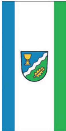
Die Bilder zeigen das Wappen und die Fahne.

Doch welche Symbolik steht hinter unserem neuen Wappen? Der silberne Wellenbalken verweist natürlich auf die geographische Lage an der Weißen Elster, das für unsere Region prägende Gewässer. Der goldene Kelch als Abendmahlskelch im blauen Feld führt dabei in symbolischer Weise die Bedeutung des bisher für Wünschendorf verwendeten Pelikans, der seine Jungen mit dem eigenen Blut nährt weiter, was für Werte wie Fürsorge, Opferbereitschaft, Nächstenliebe und Gemeinschaft steht. Darüber hinaus steht er für den historischen bis heute in der Veitskirche im Gebrauch befindlichen Abendmahlskelch. Das goldene Eichenblatt in grünem Feld wiederum nimmt Bezug auf das bisher in Berga verwendete Motiv des Eichenbaumes und steht stellvertretend für Beständigkeit, Verwurzelung und Naturverbundenheit. Die Farben der Fahne stehen symbolisch für den blauen Himmel, die grünen Auenwiesen und die Weiße Elster. Aber Sichtbarkeit ist natürlich nicht nur ein Wappen oder eine Fahne, dienen diese doch hauptsächlich hoheitlichen Aufgaben. Deshalb haben wir zusätzlich zum Wappen auch ein Logo samt Motto entwickelt. Als die ELSTERSTADT Berga-Wünschendorf, der viertgrößten Stadt im Landkreis Greiz, wollen wir selbstbewusst nach außen auftreten.