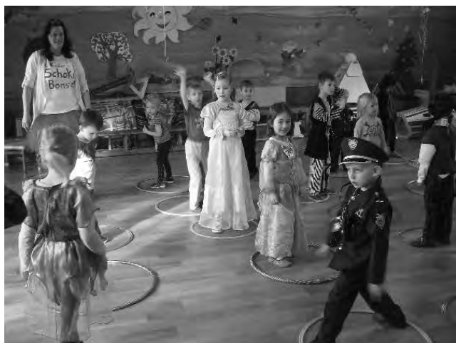
Die kleinen und großen Leut' der AWO Kita „Pustebblume“

Viele Wolfersdorfer haben bereits auf uns gewartet und uns reichlich beschenkt. Großen Dank an alle! Mit vollen Rucksäcken zogen wir zurück in den Kindergarten und freuen uns aufs nächste Jahr.