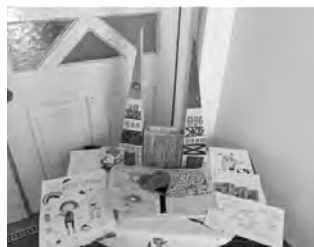
Kunstwerke der Klasse 4 der Grundschule Berga

Wir möchten uns nochmal herzlich bei allen Künstlern und Künstlerinnen für die phänomenalen Kunstwerke bedanken.