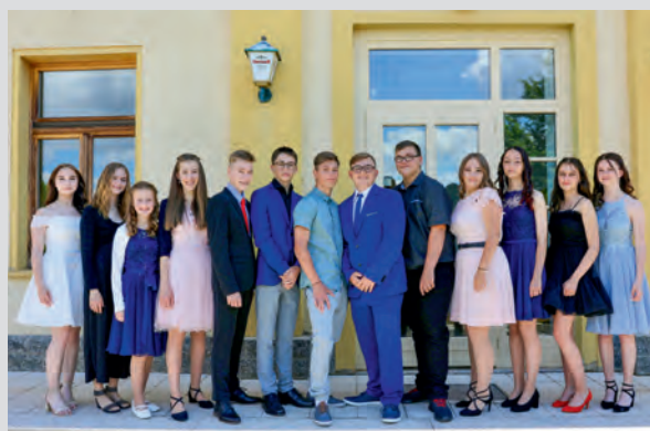
Klasse 8a und 8b

Erfolgreich durchgeführt werden konnte auch die Sommerparty des Brauchtum- und Kirmesvereins Berga e.V. am 09.07.2022 rund um das Klubhaus. Auch hier Danke an alle fleißigen und ehrenamtlichen Macher und Helfer.