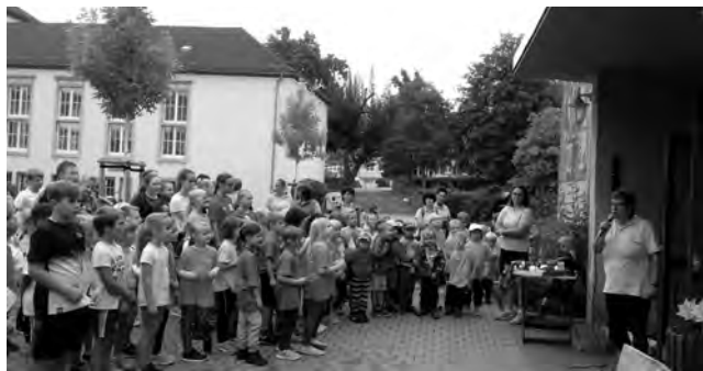
Eine Medaille für jeden Sportler.