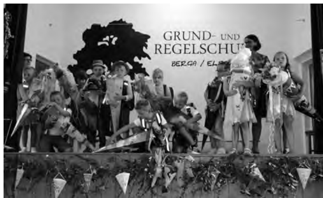
Schulanfänger der Klasse 1a