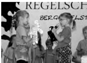
Mimi und Mo begrüßen die Schulanfänger.

Am 1. Schultag wurden die „Neuen“ auf dem Schulhof von allen Grundschulern musikalisch begrüßt und nochmals galt es, einen Zuckertütenbaum zu leeren.