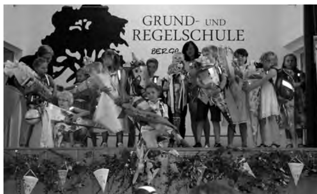
Schulanfänger der Klasse 1b

Wir wünschen allen Grundschulern ein buntes und erfolgreiches Schuljahr.