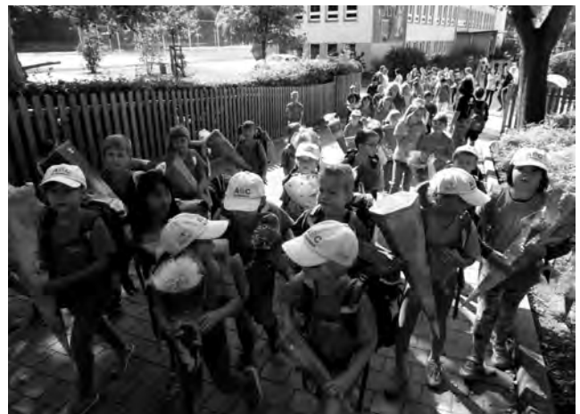
Auf zum Kirmesumzug.

Wie jedes Jahr beteiligte sich die Grundschule Berga auch 2018 am Kirmesumzug. Bunt und fröhlich trafen sich alle teilneh- menden Kinder auf dem Schulhof, bevor es zur Aufstellung am Bahnhof ging. Stolz, nun endlich ein Schulkind zu sein, trugen viele Erstklässler ihren Ranzen und die Zuckertüte, die natürlich schon lange geleert ist. Beschwingt folgten den Schulanfängern die Zweit-, Dritt- und Viertklässler. Manche waren als kleine Gärtner unterwegs, andere Kinder herbstlich geschmückt – einfach BUNT – wie der Herbst eben.