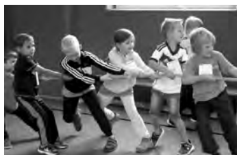
Mit Begeisterung dabei.

Die Kinder der Kindertagesstätten in Wolfersdorf und Berga waren schon die ganze Woche aufgeregt und freuten sich auf Freitag, den 7. September 2018. Sie hatten von unserer Grundschule eine Einladung auf den neuen Sportplatz zum Kirmes-Sport- und Spielfest erhalten. Pünktlich 9:00 Uhr konnte die Schulleiterin Frau Gabriel alle Gäste und Grundschüler begrüßen. Auch die Schüler der beiden 5. Klassen der Regelschule Berga freuten sich, dabei sein zu können. Los ging es zuerst mit einer Erwärmung mit Musik, die vier Mädchen der Klasse 4 übernahmen.