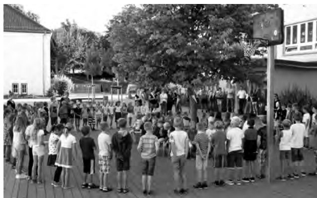
Die Erstklässler werden begrüßt.