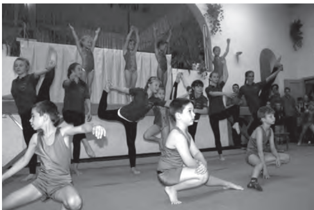
Turnerinnen und Turner des TV Kleinreinsdorf zur Leistungsschau 2017.

wir laden Sie zu unserer Leistungs- und Fotoshow und zum Saisonabschlusskonzert der Schalmeien am 20. Oktober 2018 in den Gasthof „Zum heiteren Blick“ recht herzlich ein.