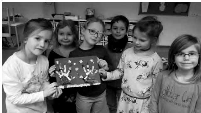
Unsere kreative Arbeit

Da unsere Kinder gern kreativ sind und auch gerne malen, machte sich die Klasse 1 mit ihrer Erzieherin gleich ans Werk. Zuerst wurden Hände bemalt und auf Papier gedruckt und jeder Finger als Schneemann gestaltet. Bäume wurden ausgeschnitten, bemalt und aufgeklebt. Schnee aus Watte und ausgestanzte Schneeflocken machten unsere Weihnachtskarte perfekt.