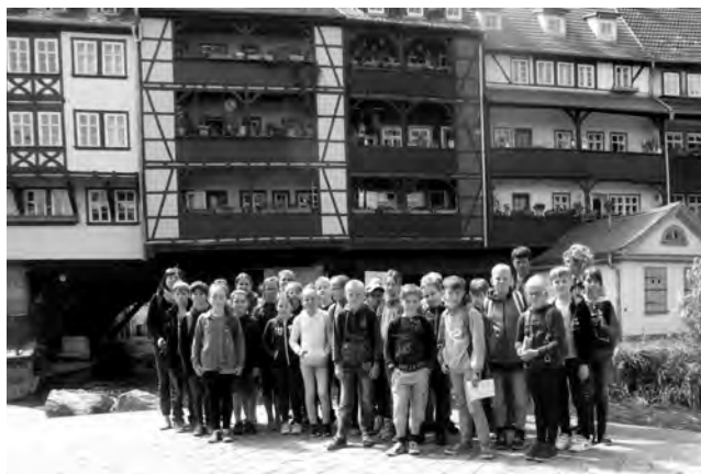
An der Gera mit Blick auf die Krämerbrücke

In ihrer freien Zeit eroberten alle Viertklässler noch einmal die Krämerbrücke, schleckten Eis, bummelten durch die niedlichen Geschäfte und kauften kleine Andenken. Nach Fütterung der Enten an der Gera, dem Austoben auf dem Spielplatz, begaben sich alle so langsam auf den Rückweg in Richtung Bahnhof. Ein letzter und selbstverständlicher Halt im diesjährigen Lutherjahr, war der Besuch des Augustiner Klosters. Leise und bedacht ließen die Mädchen und Jungen die Atmosphäre auf sich wirken. „Hier also klopfte Martin Luther an und wollte Mönch werden ...?“ Wohlbesonnen und voller bemerkenswerter Eindrücke endete dieser tolle Tag. Und auf die Frage: „Was hat euch am besten gefallen?“, antworteten alle wie aus einem Mund: „Alles!“ Und dies bedeutet: Erfurt ist immer eine Reise wert.