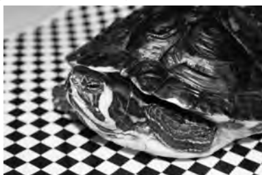
Die Schildkröte Trachemys scripta darf in diesem Jahr nicht mehr verkauft werden, Foto: Hampel

Der Schutz von Tier- und Pflanzenarten auf der Basis nationaler und EU-rechtlicher Gesetze und Verordnungen unterscheidet besonders und streng geschützte Arten. Das betrifft viele einheimische, aber, wegen dem Handel, auch fremdländische Tiere und Pflanzen. Die Haltung solcher Arten ist grundsätzlich verboten, es sei denn, sie sind legal nachgezüchtet oder legal eingeführt. Hierbei werden die bestehenden Verordnungen immer wieder verändert und angepasst. So ist der Graupapagei ab diesem Jahr streng geschützt und die Vermarktung der Buchstaben-Schmuckschildkröte ( Trachemys scripta ) verboten.