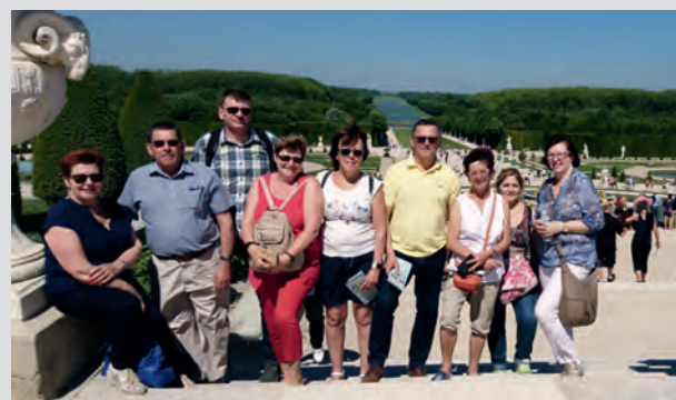
Ihr Bürgermeister Steffen Ramsauer