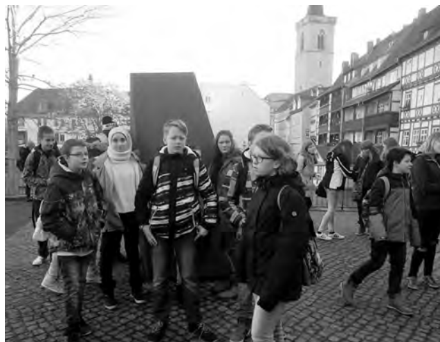
Die Klassen 7a und 7b