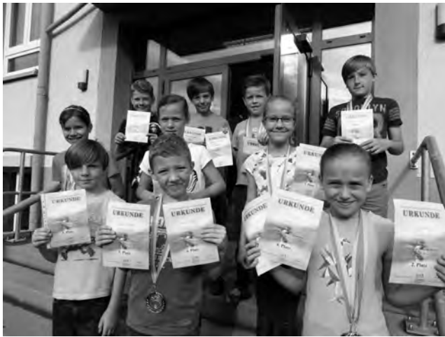
Erfolgreiche Teilnahme an den Kreisjugendspielen

Vertreter der Grundschule Berga und die Platzierungen: