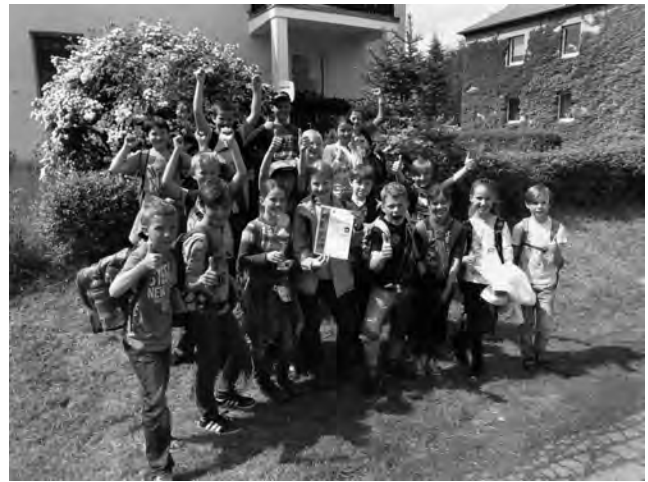
Sieger der Waldjugendspiele

Bis alle Klassen wieder am Startpunkt angelangt waren, konnten die Hüpfburg oder die anderen Angebote genutzt werden. Langsam immer aufgeregter warteten wir dann auf die Auswertungsrunde. Fest drückten wir die Daumen und brachen alle in Jubel aus, als das Ergebnis endlich verkündet wurde. Mit nur 0,2 Punkten Vorsprung belegten wir den ersten Platz, den zweiten Platz belegten die Mohlsdorfer Grundschüler der Klasse 4b. Den dritten Platz belegte die Pohlitzer Grundschule. Ein denkbar knappes Ergebnis, denn alle haben ihr Bestes gegeben und bewiesen, dass sie sich im Wald gut auskennen. Sicher konnte bei einem oder anderem Kind das Interesse an der Natur geweckt werden und auch die Klasse wurde durch die Erlebnisse noch gestärkt.