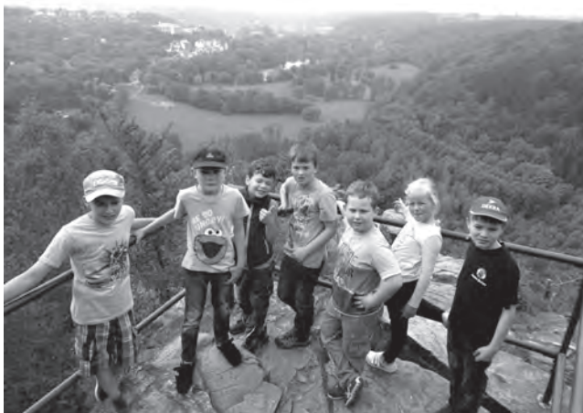
Wandertag Kl. 3a, b