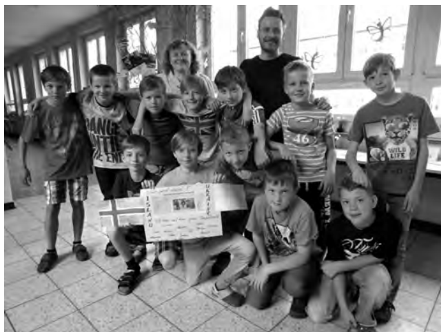
Unsere Teilnehmer an der Mini-EM

Beide Bergaer Teams konnten die Vorrunde erfolgreich überstehen und zogen als Zweitplatzierte ins Viertelfinale ein. Nachdem für die Ukraine dort Schluss war, konnte sich Island im Spiel gegen Italien (Grundschule Greiz Pohlitz) durchsetzen und den Halbfinaleinzug perfekt machen. Hier ging es gegen Österreich, vertreten durch die Staatliche Grundschule Rückersdorf. Nach einem intensiven Duell musste sich Island letztlich mit 0:1 geschlagen geben. Sichtlich enttäuscht, aber erhobenen Hauptes verließen die Spieler den Platz. Man verpasste zwar den Einzug ins Finale, dennoch kämpfte man im Spiel um Platz 3 um einen der begehrten Podestplätze. Doch auch hier hatte Island kein Glück. Nach einem langen Turniertag musste man sich – relativ deutlich – mit 0:3 gegen die Türkei (Grundschule Friedrich Reiman, Zeulenroda) geschlagen geben. Somit stand am Ende für Island ein herausragender vierter Platz auf dem Papier. Zeitgleich erspielte sich die Ukraine in zwei aufregenden Begegnungen einen beachtenswerten 7. Platz.