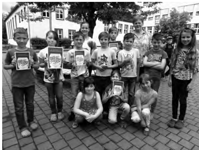
Theatergruppe der Grundschule

Das Besondere der Theatertage liegt in den sehr unterschiedlichen Themen, der sich die Schulen annehmen. So sahen wir auch ein Stück in englischer Sprache und das faszinierende Schwarz-theater und holten uns Anregungen für Neues im kommenden Schuljahr.