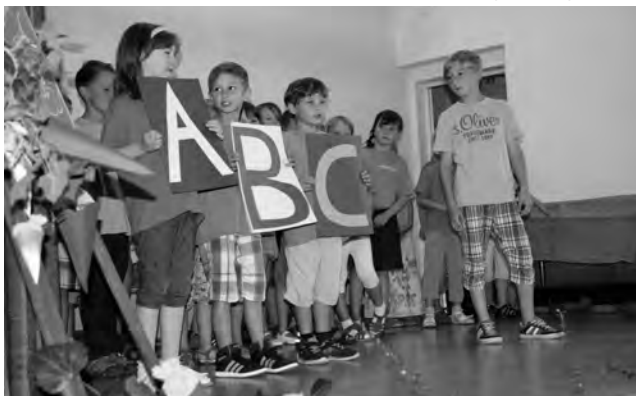
Programm zur Schuleinführung

Nachdem die Schulanfänger mit ihren Familien in der Aula Platz genommen hatten, boten ihnen die Theatergruppe mit dem Stück „Patty und der Glücksbringer“ sowie die Klassen 2a und b mit Liedern, Gedichten und Tänzen ein kurzweiliges Programm.