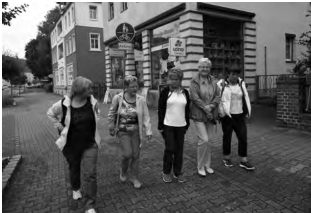
Besuch aus Walldorf – Rundgang durch Berga