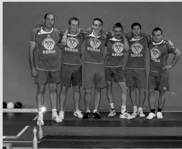
Die zweite Mannschaft des FSV Berga

Am kommenden Sonnabend kommt es dann in Wolfersdorf zum Spitzenspiel der Liga den der Tabellenzweite SV Chemie Greiz ist zu Gast. Beginn ist 13 Uhr.