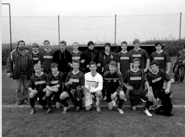
Unsere B-Junioren nach dem 4:3-Sieg im Pokalspiel gegen den FSV Ronneburg