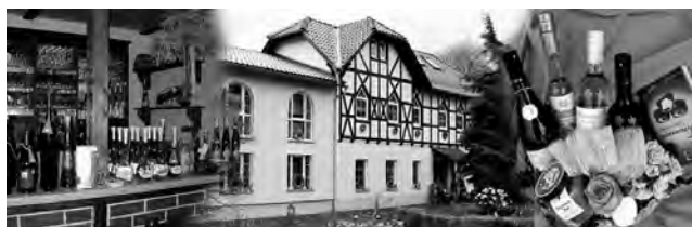
Geschäfts- und Vereinshaus Bahnhofstr. 27 Berga/Elster

Der Vorstand der Frauengruppe Wolfersdorf e.V.