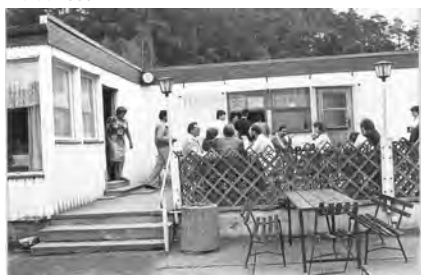
Albersdorf um 1970