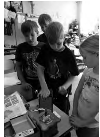
Probemahlen mit den alten Kaffeemühlen

In den folgenden Tagen der Projektwoche lernten alle Kinder der Klasse 4a, wie man ein Heft mit Packpapier einbindet und gestalteten es mit Versen in Fraktur-Schrift. Die alte Technik des Filzens übten sie und gestalteten wunderschöne Blüten. Mit Nadel und Faden wurden diese dann zu schicken Ansteckern. Viele alte Verse wurden auswendig gelernt und Volkslieder wurden gesungen. Mit viel Freude bedienten die Schüler die Kaffeemühlen zum Kurbeln. Historische Werkzeuge und Lederprodukte waren ausgestellt und fast vergessene Handwerkstechniken konnte man auf Fotos bestaunen.