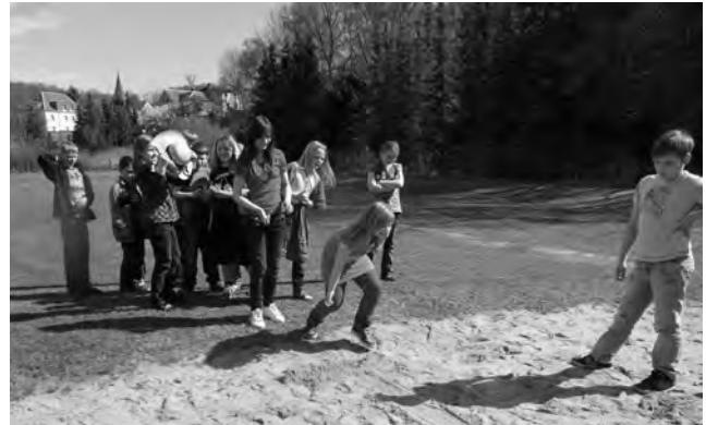
Wettkampf im Murneln Kinder Klasse 4a

nen in früheren Zeiten ein. Schnell verging dieser Tag und mit vielfältigen Erlebnissen begaben wir uns auf den Heimweg. Am nächsten Morgen lernten wir wie unsere Urgroßeltern früher auf den Schiefertafeln schrieben. Dabei gaben sich alle viel Mühe, die alte Schrift Sütterlin zu schreiben. Im Raum hörte man das Kratzen der Griffel auf dem Schiefer. Viel Freude hatten Jungen wie Mädchen beim Murnelspiel.