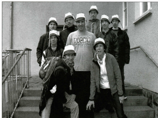
unsere Teilnehmer kurz vor der Abfahrt nach Oberhof