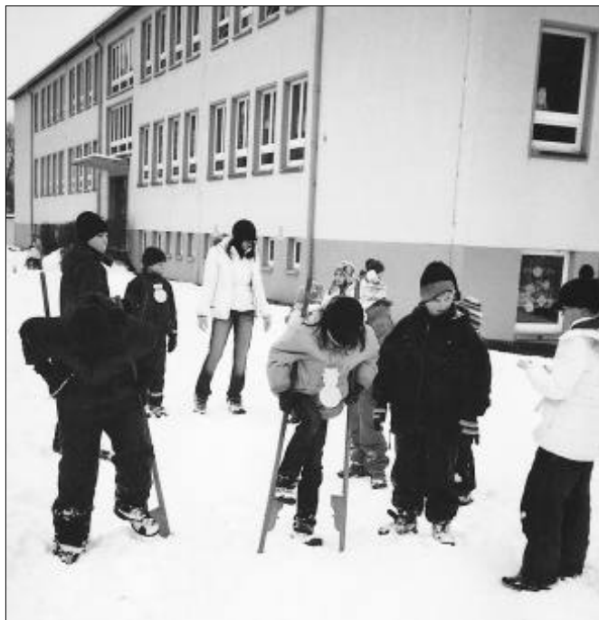
Stelzenlauf zum Kinderfest