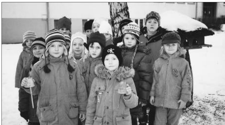
Klasse 1a mit selbstgebastelten Futterglocken