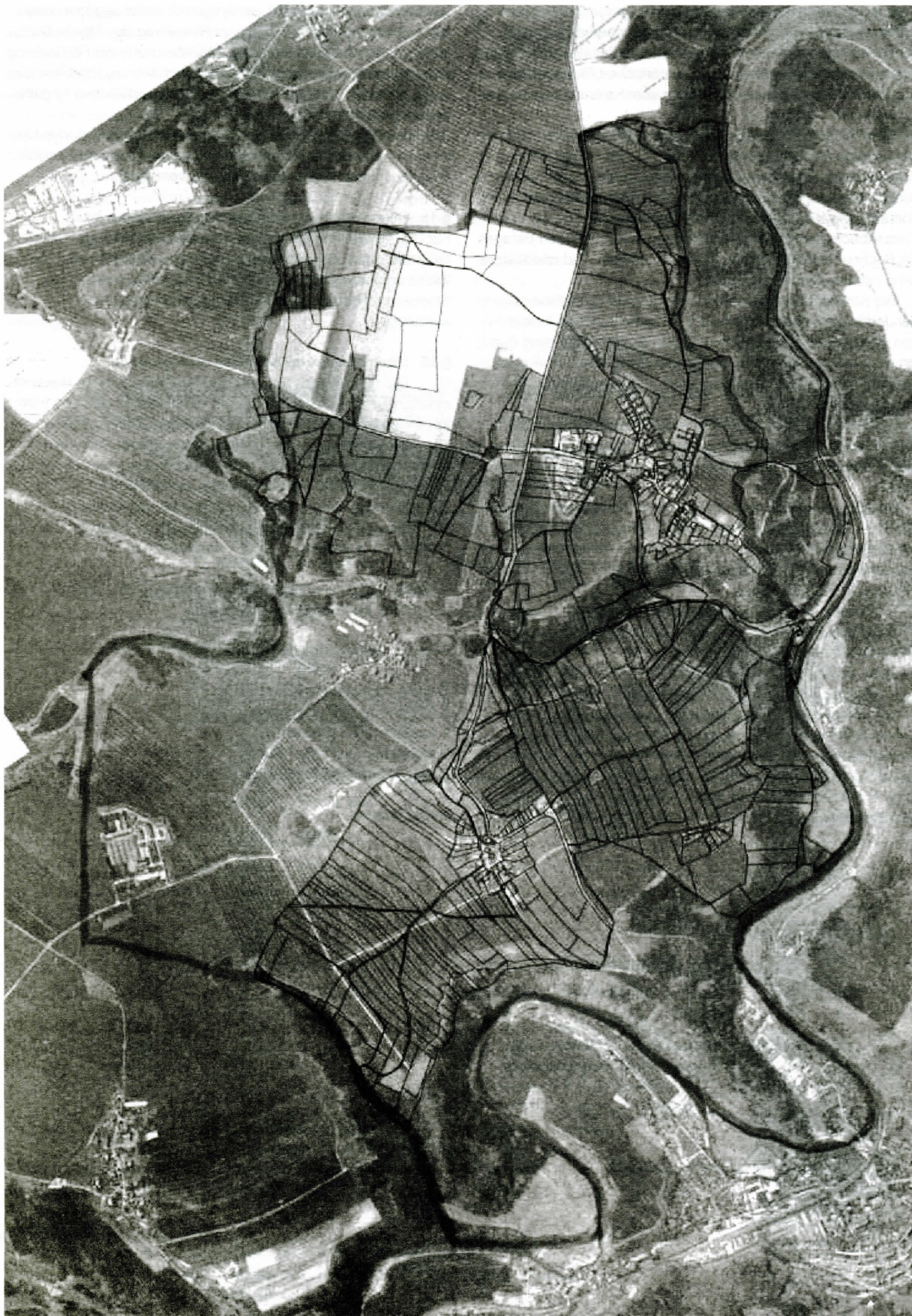
Karte zur Satzung Jagdgenossenschaft Berga