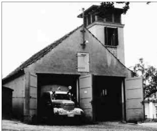
ca. 1965 Vorgänger des heutigen Gerätehauses mit »K 30«