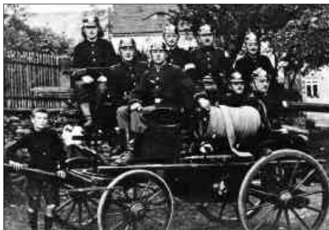
Kameraden der Feuerwehr 1924 mit Handruckspritze