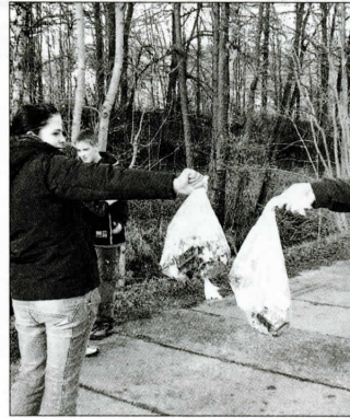
Ergebnis der Sammlung von einem Tag