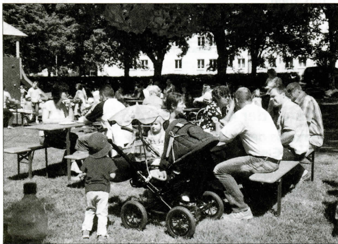
Kaum eine Platz mehr frei

Glück haben wir schon gehabt, denn die Sonne strahlte vom blauen Himmel und lockte damit viele Kinder mit ihren Eltern und Großeltern aus dem Haus, zu unserem Kinderfest.