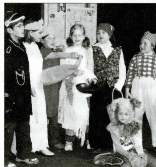
Theatergruppe bei der Vorstellung