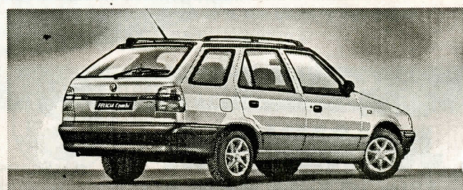
Modell GLXi, Sonderausstattung: Alufelgen.

Preis- Sensation! SKODA Felicia ab 13.000,- DM.*