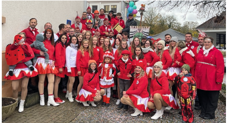
Habt es fein ... eure Närrinnen und Narren vom VCC Veitsberg NEWAHR!

Bis dahin machen wir es uns gemütlich, polieren nochmal sämtliche Pailletten, proben noch ein wenig für das Programm und wünschen eine gute Zeit!