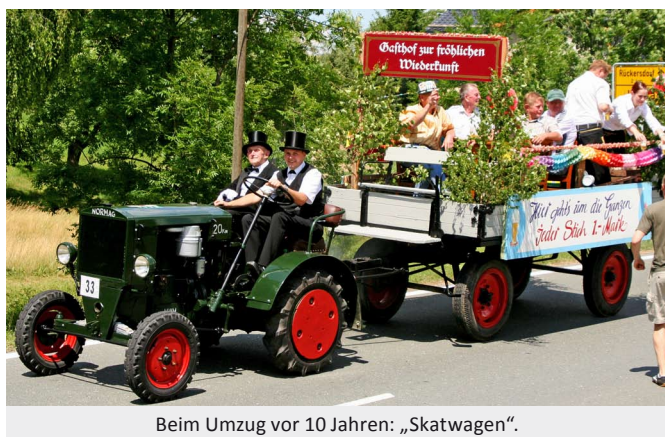
Beim Umzug vor 10 Jahren: „Skatwagen“.

Am 18. Juni 2017 beginnt der Kulturverein Linda e. V. sein Dorf- und Kinderfest mit einem Umzug. Nach zehn Jahren soll dieses Jahr das Kinderfest wieder einmal mit einem solchen Highlight beginnen. Auf ein festes Thema wie damals, als der Ort Pohlen sein 750-jähriges und Linda sein 700-jähriges Bestehen gemeinsam gefeiert haben, wird diesmal verzichtet. Die Einwohner der Gemeinde sollen die Vereine, ihre Hobbys und ihr Handwerk vorstellen, wobei der Bezug zur Vergangenheit durchaus hergestellt werden soll.